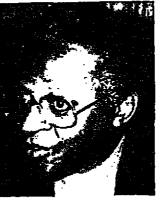
ديز موندوتو واحد أبرز قادة السود في جنوب أفريقيا

الذي في ذلك الغيتو . حتى لو امتلكت بيتنا بمقولا في ذلك الغيتو . منذ عام وعد رئيس الوزراء بيتر بوتس واجراء اصلاحات في نظام جنوب أفريقيا وابلغ البيض بان عليهم « اما ان يتكفروا او يموتوا » هل تعتقد ان تقدما ما قد تم في هذا المجال ؟